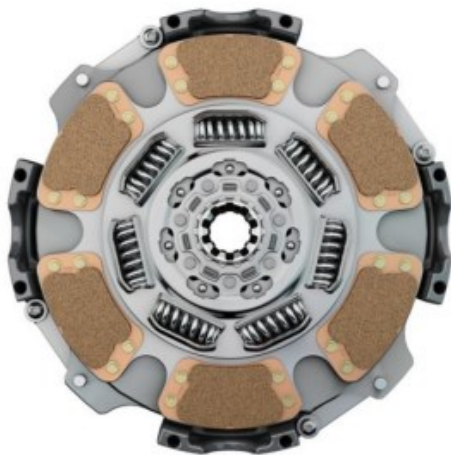
Embrayage EASY PEDAL - VCT